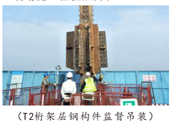
(T2桁架层钢构件监督吊装)