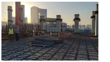
(T2桁架层钢构件监督吊装)