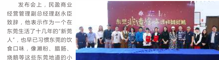
(市文化馆、国贸城项目代表与11个非遗项目代表发布会现场合影)

东莞非遗墟市是2016年东莞市文化馆、东莞市非遗保护中心创新打造的一大品牌活动, 每周六在市文化馆按时开市。此次携高步矮仔肠、荔枝柴烧鹅、李全和糖柚皮麦芽糖、清溪荔枝蜜、庾家粽、保安围扣肉等11个非遗项目签约进驻国贸城莞邑故事街区, 旨在立足新环境, 实现非遗墟市整体项目的升级, 既有利于推广“东莞非遗墟市”这个城市活动品牌, 也有利于促进东莞非遗项目现代化转变, 促进东莞非遗项目更快融入城市生活, 将向社会传播东莞悠久的饮食文化和历史习俗。国贸城对东莞非遗墟市的邀约, 是基于打造莞邑故事文化街区的业态定位, 以东莞文化匠心打造为基调, 其认为东莞非遗最能彰显本土特色、本土情怀, 突显国贸城莞味元素。今后, 国贸城东莞非遗墟市的启动, 与市文化馆的东莞非遗墟市既遥相呼应, 又为墟市项目错位发展创造有利条件, 国贸城现代化的管理模式和先进的经营理念, 也为东莞非遗墟市的规范管理和健康发展, 提供不可替代的资源。